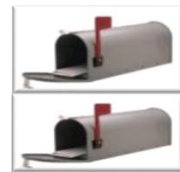
Mail flex, con mucha más capacidad de correo Electrónico.