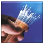
100% Fibra Óptica Disponibilidad desde 99,7 %