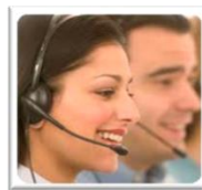
Atención y Soporte 7 x 24