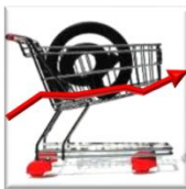
Estadísticas de Tráfico MRTG y Avanzadas