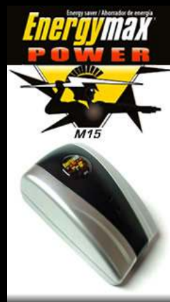
Ahorrador de energía de energía monofásico de uso general 15000 watts