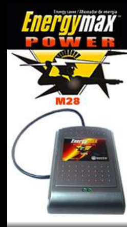
Ahorrador de energía de energía mono bifásico de uso general 28000 watts