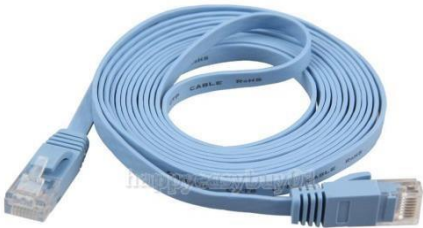
Punto Cableado (UTP)

Claro como parte de su compromiso por mejorar la experiencia de navegación de nuestros clientes, pone a disposición tres alternativas para mejorar la cobertura del servicio de banda ancha dentro del hogar.